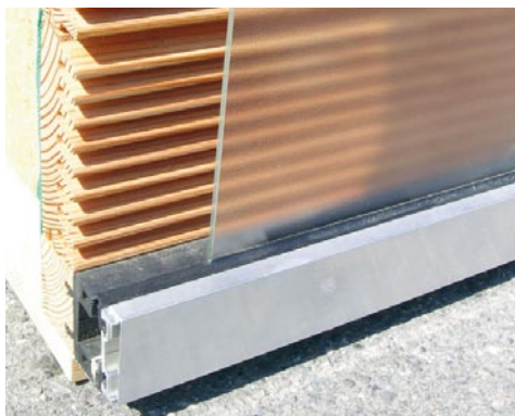
Détail façade « Lucido® »