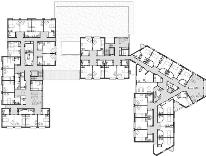
Espace commun psychogériatrie